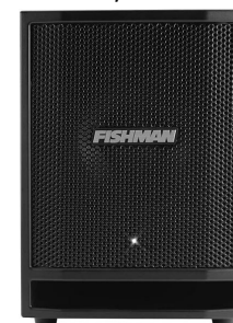
サブウーファー (パワード) (Fishman「SA SUB」) ※追加有料オプション