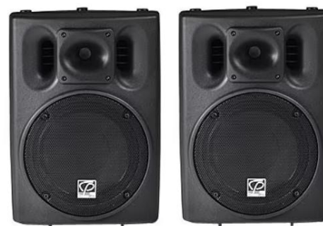
スピーカー(パッシブ) (Classic Pro「CSP10」)