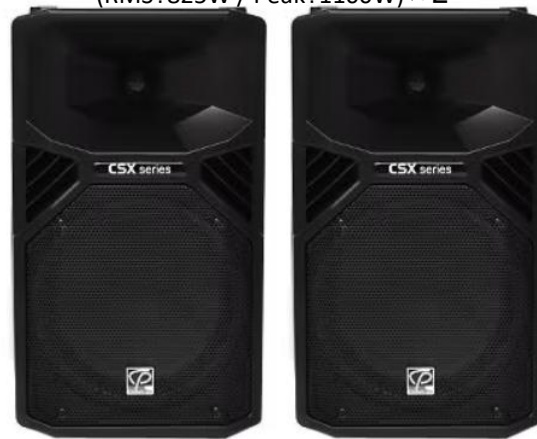
スピーカー(パワード) (Classic Pro「CSX12P」) ※追加有料オプション